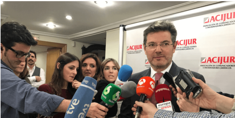
El ministro de Justicia, Rafael Catalá, durante los premios ACIJUR.