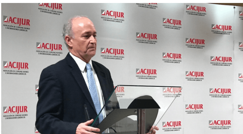
El magistrado Vicente Magro durante los premios ACIJUR, donde consiguió el galardón “Puñetas periféricas”.

“ Magro: Podría utilizarse el incremento en costas si la parte se opusiera a ir al mediación. Estoy de acuerdo con el sistema de vencimiento ”